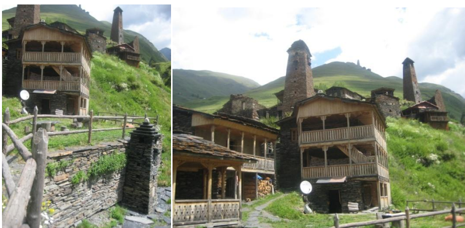
ხის არქიტექტურა თუშეთში